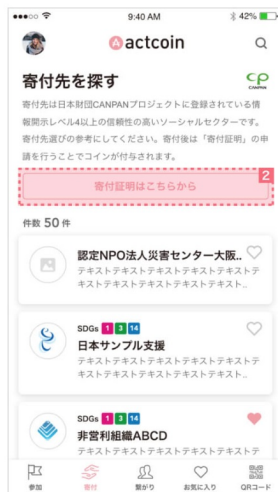
2 「寄付証明はこちら」をタップ