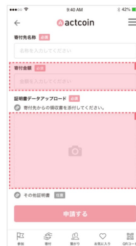
6 寄付金額には領収書に記載されている金額を記入