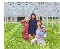
プロジェクト メイン画像