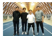
プロジェクト メイン画像