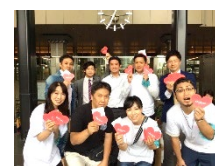
プロジェクト メイン画像