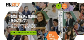
プロジェクト メイン画像